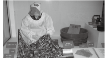
昔懐かしい風景が

▷期間= 8月6日(土)～10月23日(日) 9時30分～17時 ※月曜・9月30日(金)は休館(祝日は開館、翌火曜休館) ▷場所=博物館 ▷入館料=無料