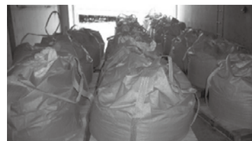
クリーンセンター内に保管されている焼却灰

市民の皆さんにも、ぜひともこの窮状をご理解いただき、ごみ減量に向けて今まで以上のご協力をお願いします。ご自宅内で刈り取った草や落ち葉などは、支障のない範囲で